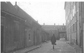
3 Reunie 2005 018

2 Johannes de Wit [watersnood] , geboren op 12 maart 1951 in Dinteloord en Prinsenland. Johannes is overleden op 1 februari 1953 in Dinteloord en Prinsenland, 1 jaar oud (oorzaak: watersnoodramp) [bron: akte 9]. Van het overlijden is aangifte gedaan op 27 februari 1953 [bron: akte 12].