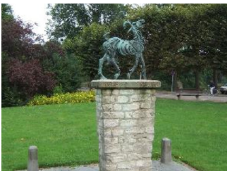
1 Geitje van Mie den Os

VIII-iu Pieterella Martina Franken [QuMa0167206] is geboren op 16 december 1883 in Bergen op Zoom, dochter van Arnoldus Franken [QuMa0167205] (zie VI-am) en Maria Catharina Franken [QuMa0291007] (zie VII-ck). Pieterella trouwde, 18 jaar oud, op 9 mei 1902 in Bergen op Zoom met Antonius de Kort [QuMa0173007] , 19 jaar oud. Antonius is geboren op 18 januari 1883 in Bergen op Zoom, zoon van Cornelis de Kort [QuMa0173006] en Berbera Schot.